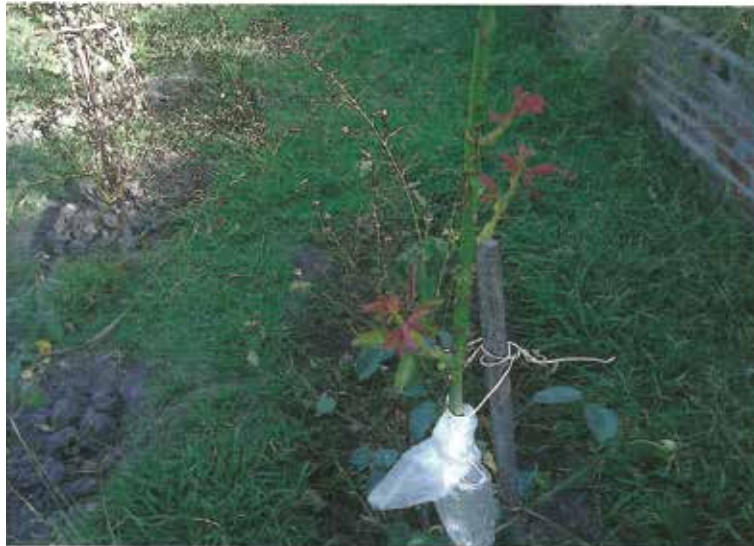
Injertos hechos de mi rosal sport sobre la variedad Crepè de Chine

“La Rosa” o “El Rosal” es, creo yo como tantos otros personajes sabios, no como yo que soy un sencillo observador que la denominan “la reina de las flores” a lo cual han contribuido hombres y mujeres en la creación de una interminable cantidad de diversas tonalidades, color, formato, perfume y otras virtudes, y este forma de crear nuevas rosas es un camino tal vez sin fin, hay muchas formas en la vida de ser feliz pero yo creo que el poder disfrutar sus flores en colores o en cualquier tipo y porque no también con su fragancia son dotes difíciles de igualar, cada día en adelante aparecerán nuevas rosas y los halagos aumentarán.