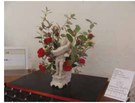
Diseño "Al compás de..." Expositor: Beatriz Vitassovich - GANADOR -