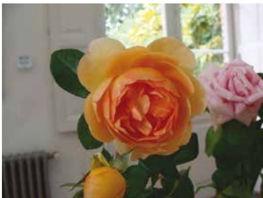
"Pat Austin" Expositor: Bettina Crosta - GANADORA MEJOR ROSA PERFUMADA -