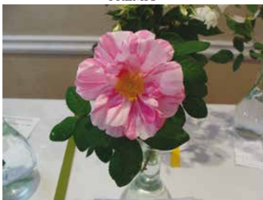
Clase 1: Rosas Especie Rosa gallica versicolor Expositor: Valeria Chediak