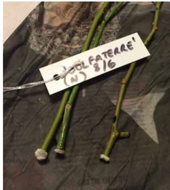
Luego de tres semanas se puede abrir el envoltorio y observar si crecieron las raíces. Si no es así se vuelve a envolver y guardar.