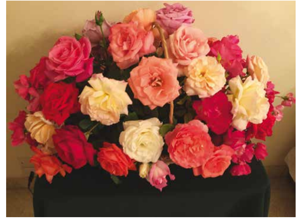
Canasto de colección de rosas modernas