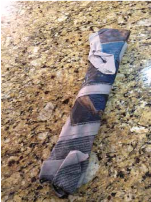
Envolver los esquejes en el papel diario húmedo, se pueden envolver varios juntos