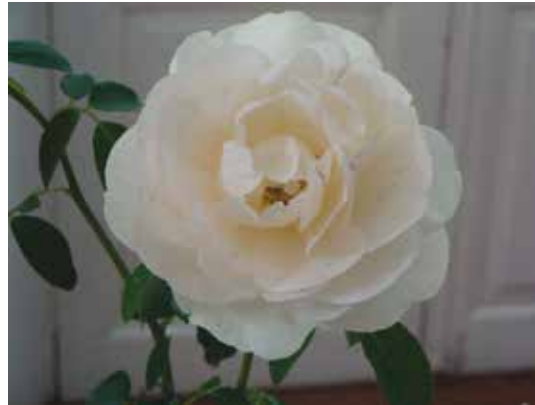
"Angel" Expositor: Valeria Chediack