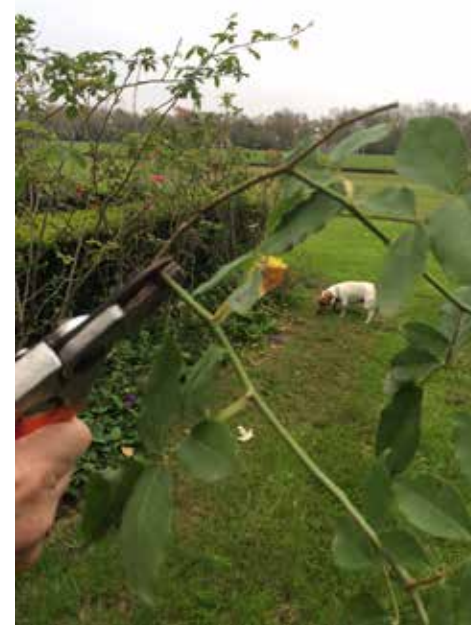
Cortar un esqueje delgado, aproximadamente del grosor de un lápiz, de unos 25 cms de largo