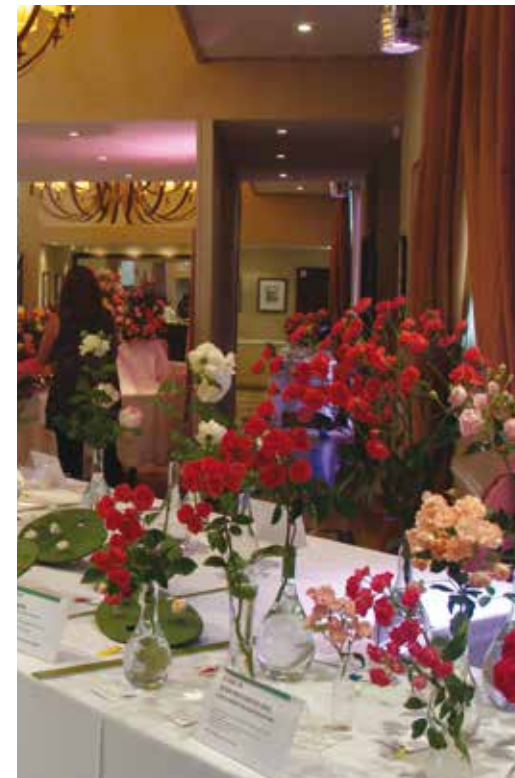
Vista general de la Sección Horticultura