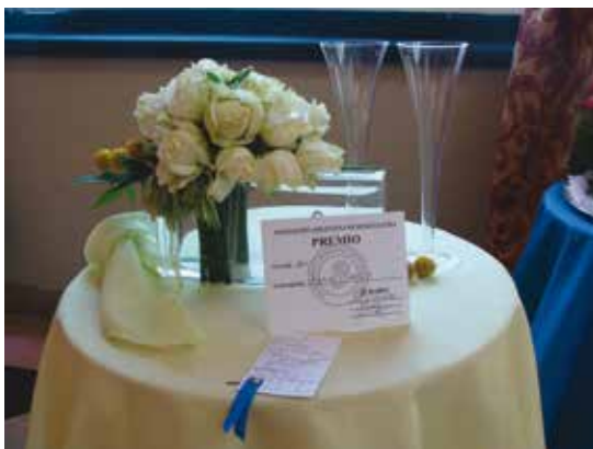
Clase 38: Brisas de Fiesta . Para diseñadores jóvenes y sus amigos o familiares. Más de 10 años Expositores: Camila García y Tere Tamburo PREMIO