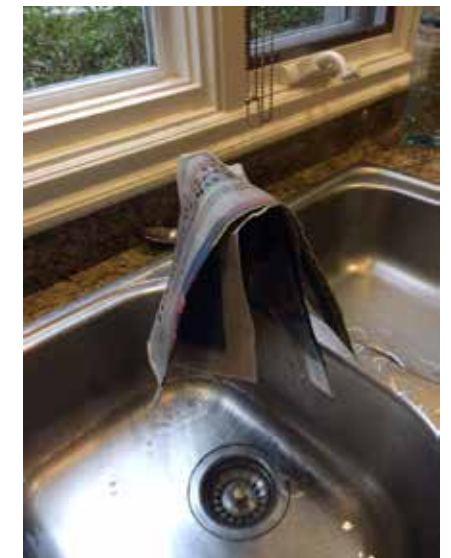
Ecurrir las hojas para que tengan exceso de agua