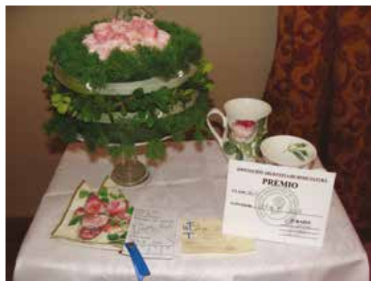
Clase 38: Brisas de Fiesta . Para diseñadores jóvenes y sus amigos o familiares. De 6 a 9 años Expositor: Sofía de Luca PREMIO