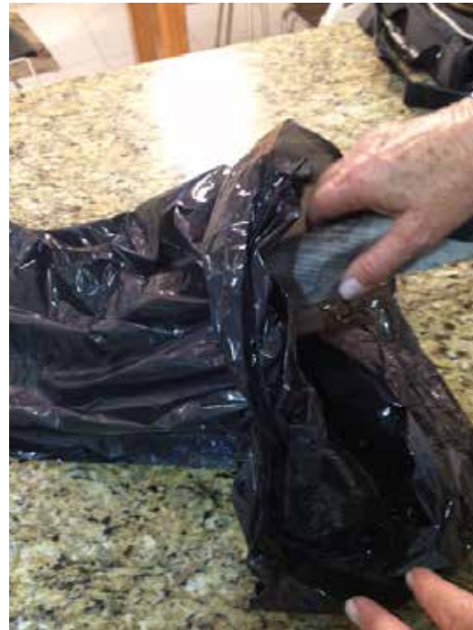
Colocar el envoltorio de papel en una bolsa de plástico negro