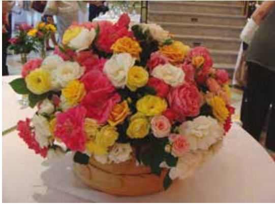
Clase 36: Canastos Expositor: Violeta Hisaki Medalla de la AARr