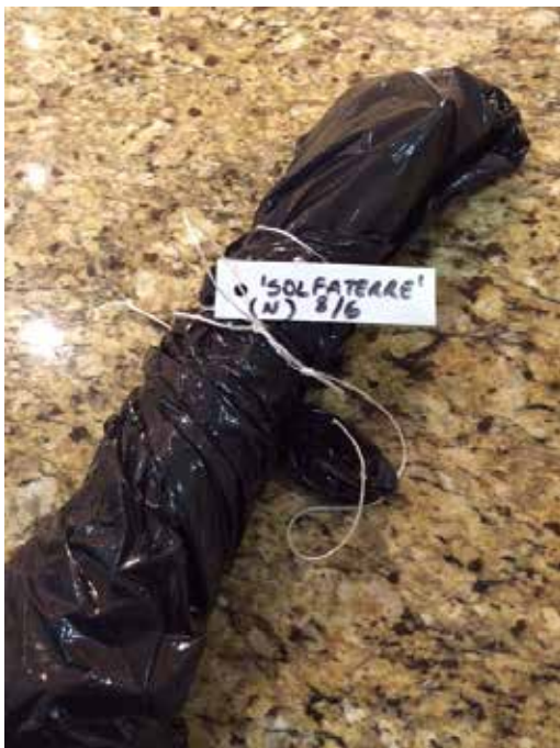
Cerrar la bolsa, colocar el rótulo y guardar en un lugar oscuro