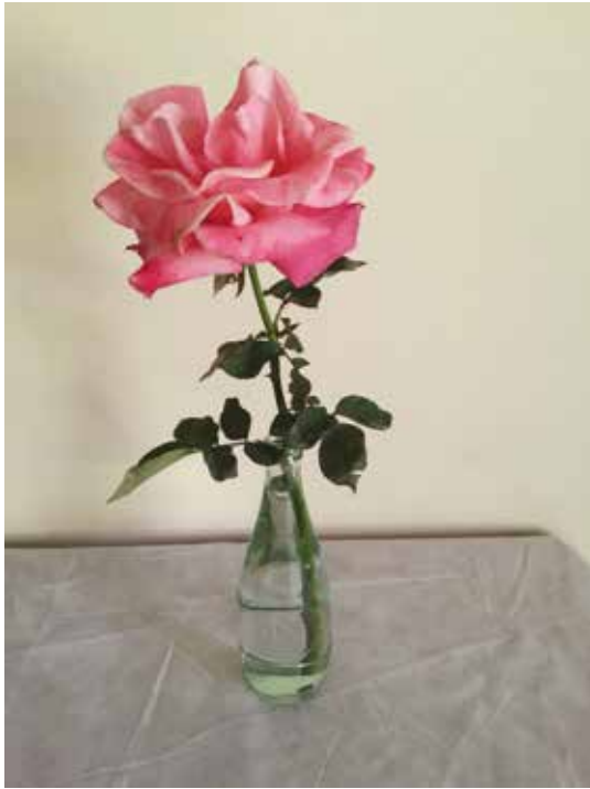
"First Prize" – Híbrida de Té