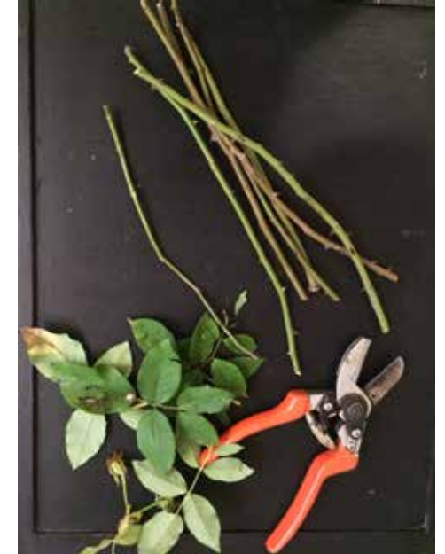
Quitarle todas las hojas