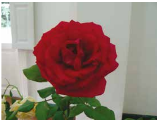
"Victor Hugo" Expositor: Renata Frischen - GANADORA MEJOR ROSA DE LA MUESTRA -