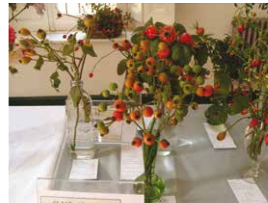
Escaramujos Expositor: Esther Garabato - GANADOR MEJOR ESCARAMUJO -