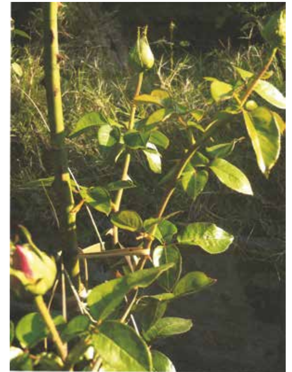
Rosal “Rosa e Isabel de Chinelli”, sport de Kronenbourg

Quiero decir también que tanto Queen Elizabeth como Crepè de Chine (hay muchas