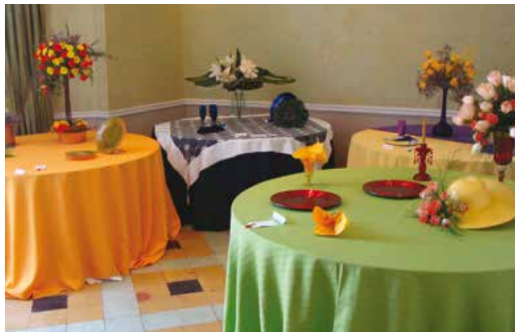
Vista del Sector Diseño