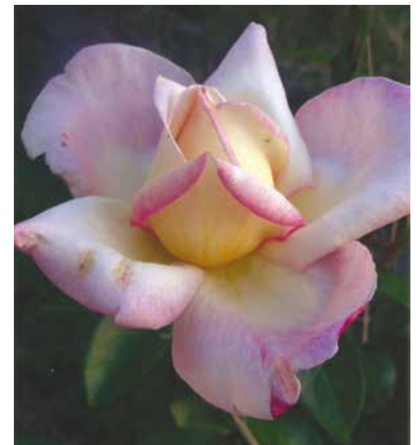
Rosal “Rosa e Isabel de Chinelli”, sport de Kronenbourg