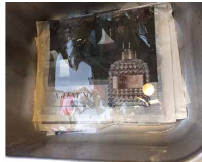
Remojar hojas de diario en agua